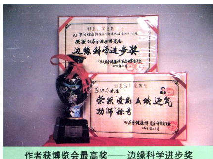
作者获博览会最高奖——边缘科学进步奖

8月31日中华人民共和国公安部所属中华见义勇为基金会致中国气功科学研究所的感谢信。